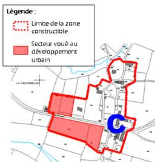
Hameau Cherbonnelais avant la modification du périmètre constructible

Le zonage sur le secteur du hameau de la Cherbonnelais a donc été modifié. Les surfaces constructibles au sud ainsi qu'au nord-ouest du hameau ont été réduites, comme indiqué ci-dessous.