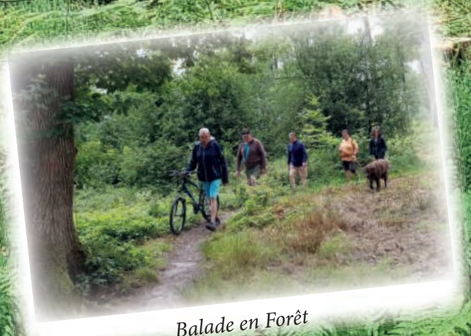
Balade en Forêt