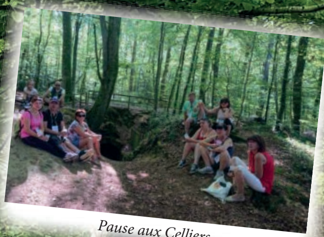
Pause aux Celliers