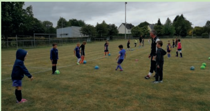
Reprise des entraînements U9 le 4 septembre.

Tous les championnats des équipes sont à retrouver dans le livret des supporters, disponible courant novembre chez nos sponsors ou sur le site internet du club : http://club.quomodo.com/parignelandeanfoot/accueil