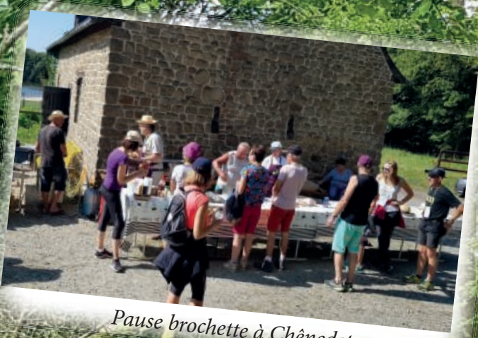
Pause brochette à Chênedet