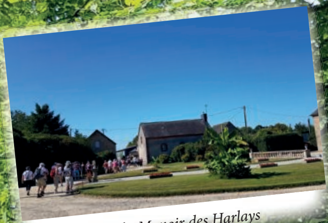
Départ du Manoir des Harlays