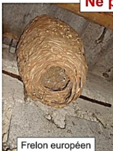
Frelon européen Vespa crabro Nid ouvert en dessous