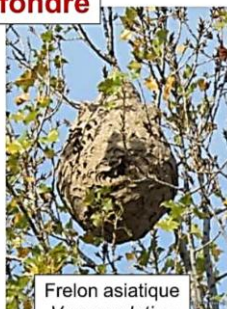
Frelon asiatique Vespa velutina Nid fermé en dessous Entrée latérale